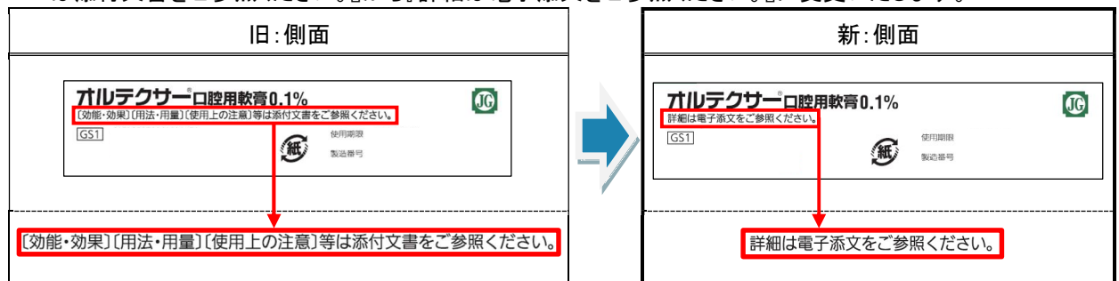
※上記はイメージです

添付文書の同梱廃止に伴い、個装箱の添付文書に関する表示を『〔効能・効果〕〔用法・用量〕〔使用上の注意〕等は添付文書をご参照ください。』から『詳細は電子添文をご参照ください。』に変更いたします。