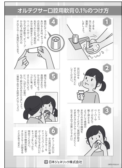
※上記はイメージです