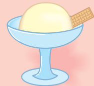
バニラ アイスクリーム