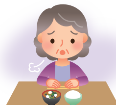
食欲がなく食事がとれない