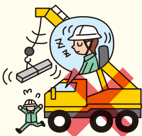
危険をともなう 機械の操作