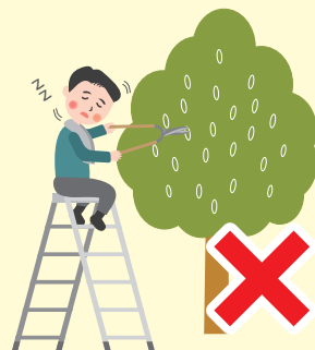
高いところでの作業